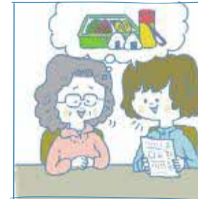
にほんご はな かぞく しょう 日本語が話せない家族や障 がいのある家族のために通 訳 つう している

にん 30人のクラスなら ひとり ふたり 1人か2人いる 計算 けいさん になるね