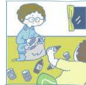
やくぶつ アルコール・薬物・ギャンブ ちんだい かか かぞく めんどう ル問題を抱える家族の面 面 み を見ている