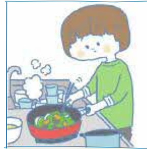
びようき しょう かぞく 病 気や障がいのある家族 のために、家事をしている