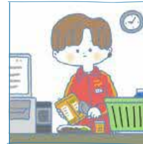
かけい ささ しごと 家計を支えるために仕事を している