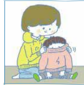
かぞく か おきな 家族に代わって、幼いきょう だいの世話をしている