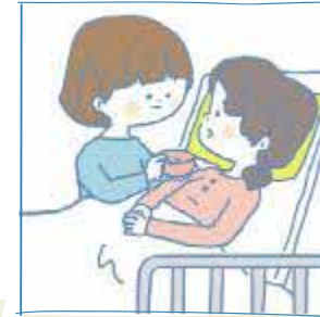
びようき しょう 病 気や障がいのあるきょう だいの世話や見守りをして いる